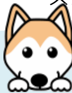
編集者より ひとこと