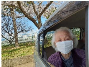
キレイな 桜を満喫